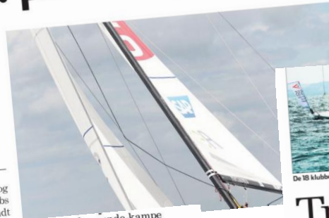
11.00: Anden runde-kampe

SEJLSPORT Der var masser af vind, og endda så meget, at Silkeborg Sejlklubs båd satte hastighedsrekord blandt 170-bådene ved årets anden ligasæ-