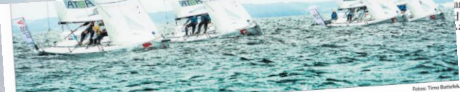
De 18 klubber skiftes til at sejle banen. Seks hold dyster mod hinanden ad gangen.

Liga-udfordringen gribes seriøst til værks. Og pulsen var høj ved det første stævne. - Vi var vildt spændte. Nerven sad i tøjlet, og vi på trim og anede sim- I der ven-