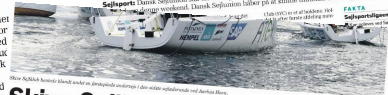
Silkeborg Sejlklub hentede blandt andet en førstplads undervejs i den sidste sejlsædlerunde ved Aarhus Havn.

SEJLSPORT: Sæsonen je stævne i Sejl Sportsbød på tre dage med intense sejlsædler uderup - med Roskilde klub som vinder. De 18 klubber i den nedte Sejl Sportsliga DM for s