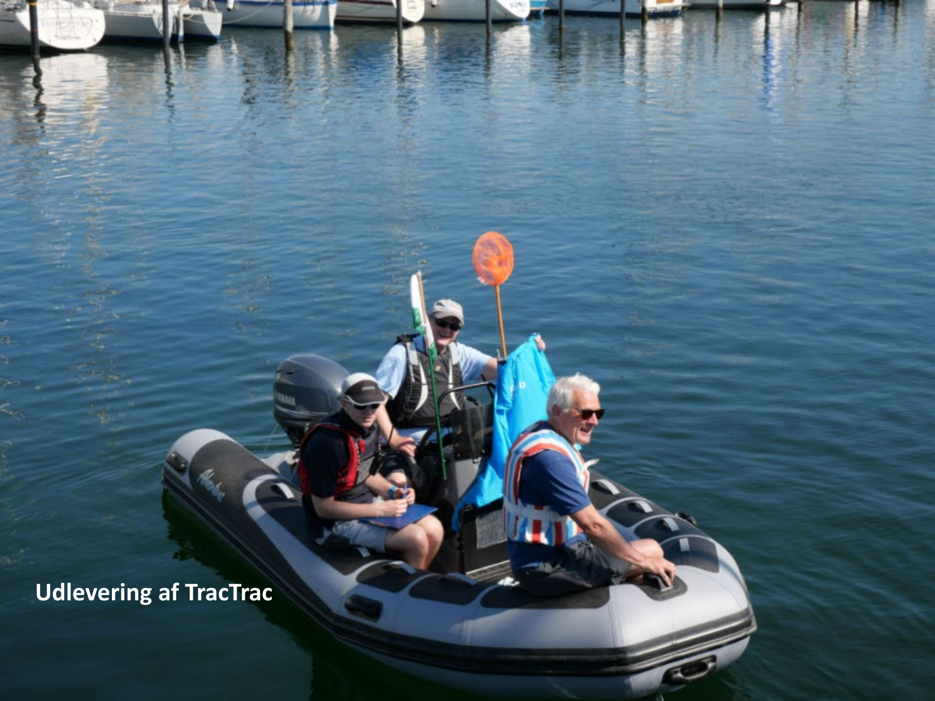
Udlevering af TracTrac