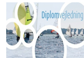
"System" / motivation