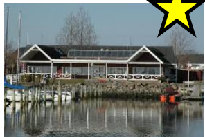
Den fysiske klub