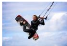
Kite, surf, jolle