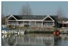
Den fysiske klub