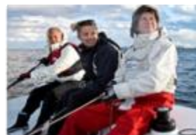
Selvtræning, hold / alene