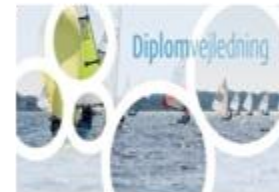
"System" / motivation