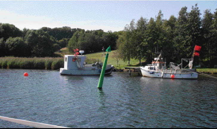
Af Anders Høegh Post

Haderslev Fjord snor sig 8 sømil ind mellem siv, skove og marker, og næsten ingen huse ses. Sejllobet er 6 m dybt og afmærket med bøjer nær 2 m kurven. Nogle steder kan man sejle uden for løbet, andre steder bestemt ikke.